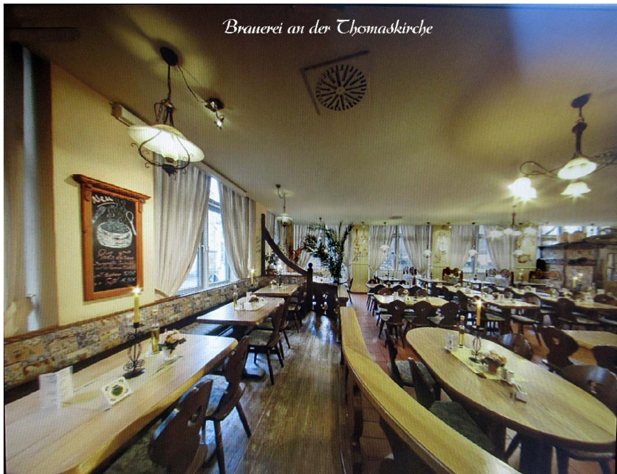
Gaststätte „Brauhaus“ an der Thomaskirche, Thomaskirchhof