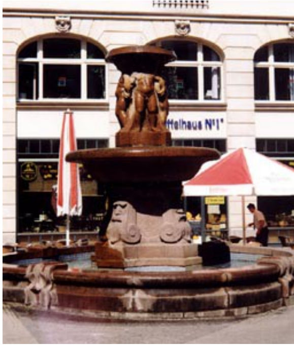
Cafe „Kaffeebaum“ Kleine Fleischergasse 4